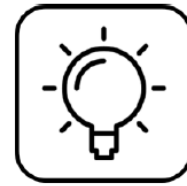
Diseño de logo